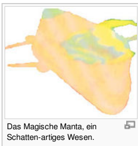
Das Magische Manta, ein Schatten-artiges Wesen.

Das Magische Manta ist ein riesiges, scheinbar aus Schleim bestehendes, Manta-ähnliches Wesen, dass in Isla Delfino in Erscheinung trat und von der dortigen Umgebung auch zu stammen scheint. Es ist hauchdünn und gleicht in vielen Aspekten einem Schatten, so "gleitet" es über den Boden und scheint dabei von keinem Hinderniss gestoppt werden zu können. Zudem besitzt es die einzigartige Fähigkeit Elektro-Schleim zu produzieren, eine extrem gefährliche Variante des Schleims , welchen es hinter sich herzieht und überall dort hinterlässt, wo es sich aufgehalten hat.